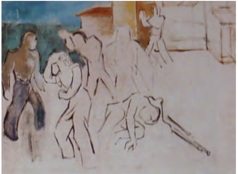
Franz Monjau. Zerschlagung des Widerstandes (unvollendet) (1943-44) Öl/Lw., 64 × 85 cm. Stadtmuseum Düsseldorf

Literatur: Franz Monjau. Hrsg. v. Mieke Monjau. Düsseldorf 1993