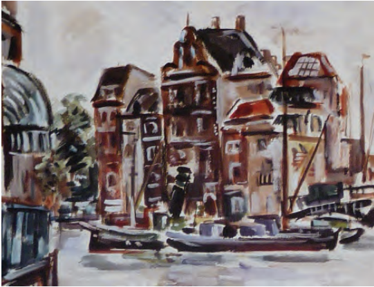
Franz Monjau. Amsterdam 1934 Lasierende und deckende Wasserfarben, 36 × 45,5 cm Privatbesitz

der Welt! Vom ersten Besuch in dieses vom Kampf zerfetzte Berlin bis heute sind 5 Monate vergangen, und kaum kann man sich vorstellen, wie furchtbar es hier ausgesehen hat. Der Film «Berlin» zeigt die Wirklichkeit. Und heute ...Theater, Opern, Kunstausstellungen, Zeitungen, Radio. Und täglich fragt man sich «ist denn alles Wirklichkeit, ist das Leben wieder zurückgekehrt. Ja es ist zurückgekehrt.»