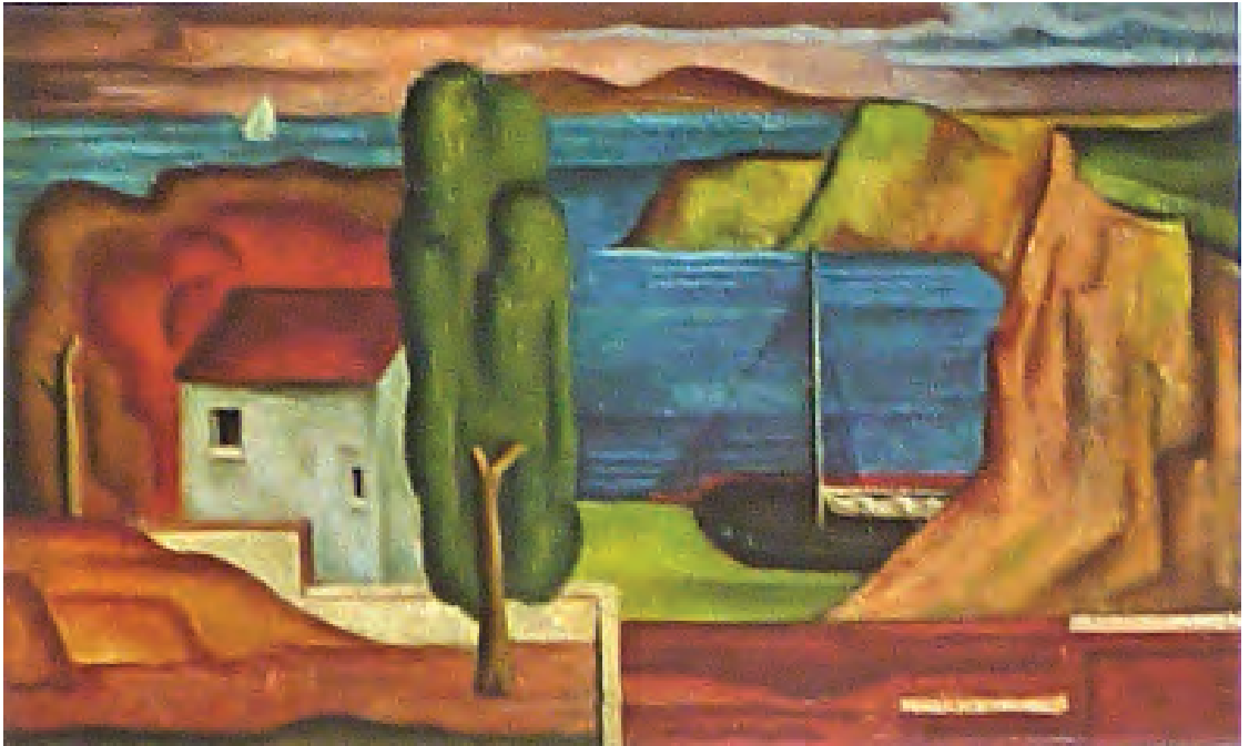
Franz Monjau. Südliche Landschaft . 1929 Öl/Lw., 41 × 65 cm, Museum Kunstpalast, Düsseldorf