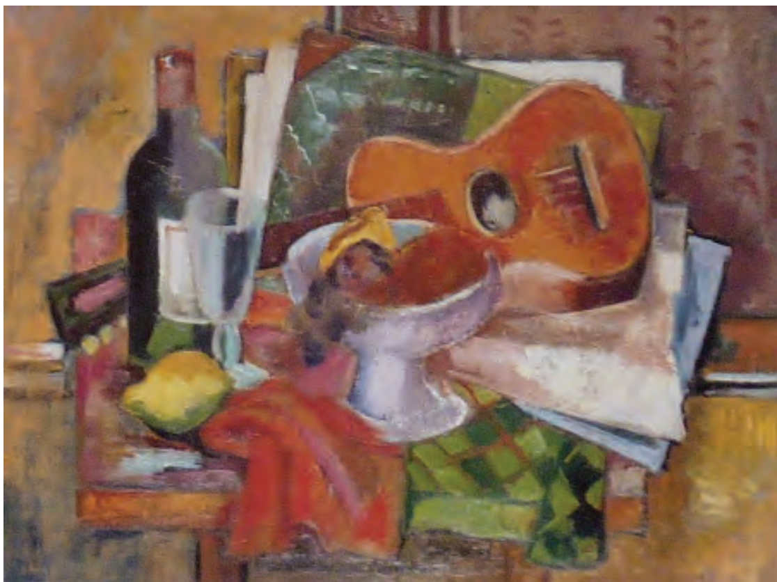
Franz Monjau. Stilleben , 1928 Öl auf Leinwand, 50 × 65 cm. Rheinisches Landesmuseum Bonn