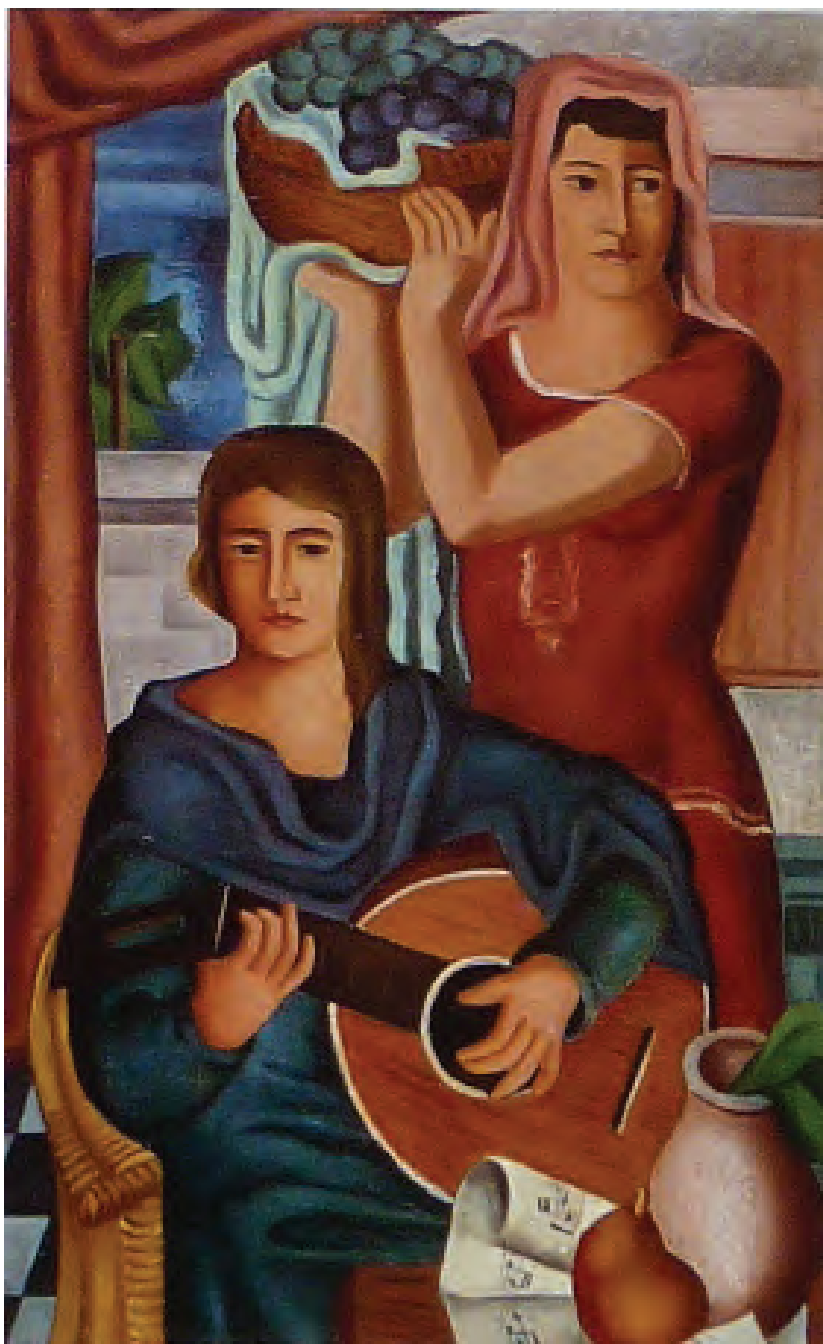
Franz Monjau. Zwei Frauen mit Gitarre . 1929 Öl auf Leinwand, 85 × 55 cm. Stadtmuseum Düsseldorf