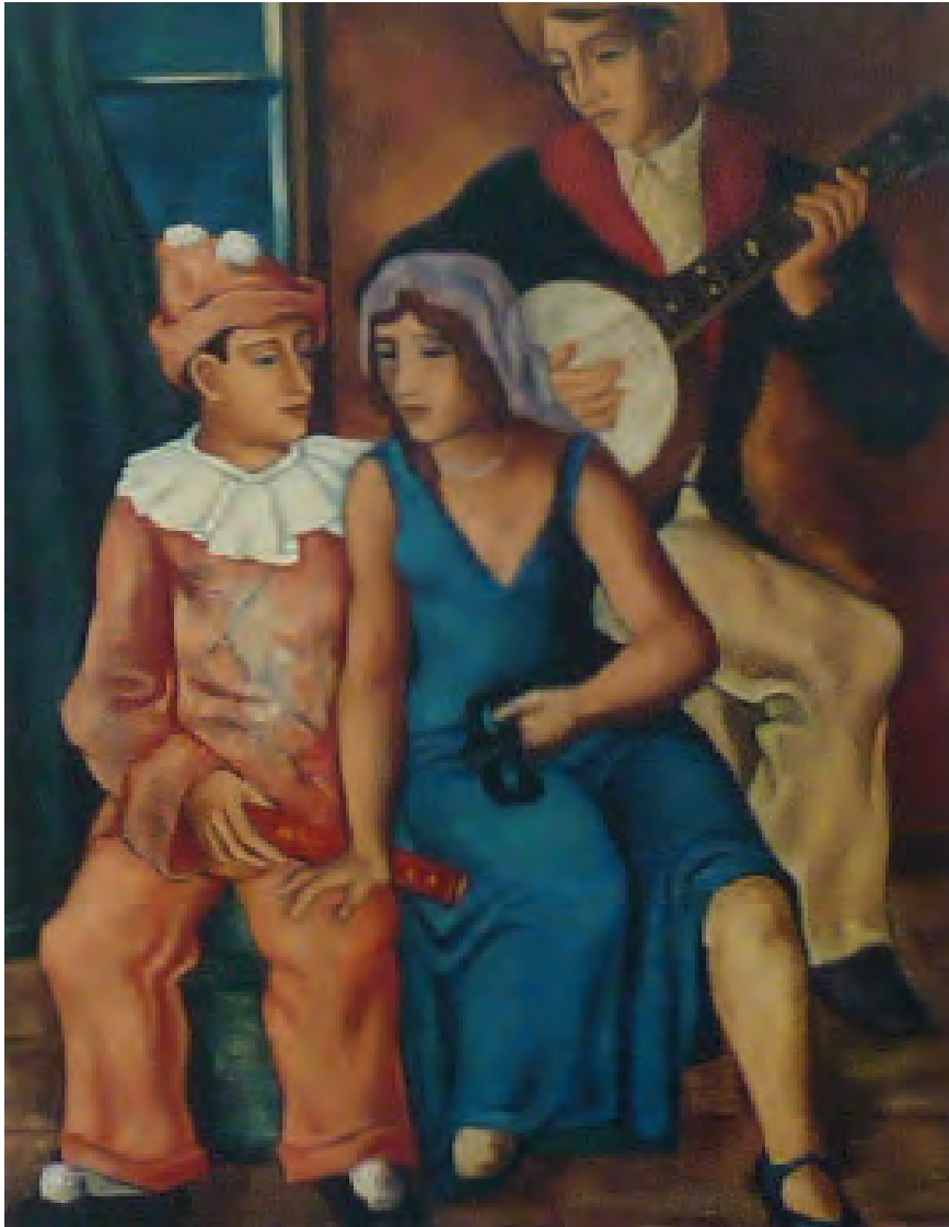
Franz Monjau. Karneval (Der Künstler mit seiner Frau) 1929 Öl auf Leinwand, 92 × 73 cm. Stadtmuseum Düsseldorf