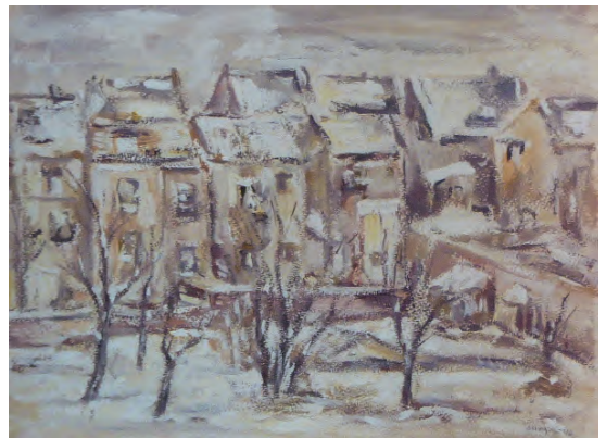
Franz Monjau. Blick aus dem Atelier Leopoldstrasse im Schnee, 1940. Gouache, 37 × 50 cm. Stadtmuseum Düsseldorf

Diese Woche habe ich versucht, die Reisegeheimigung für Düsseldorf zu erhalten. Gesperrt! Sobald es geht, komme ich selbst. Deine Mutter und Tante Else werden Dir diesen Brief, wenn sie allein fahren müssten, bringen. Ich komme sobald wie möglich nach! Inzwischen arbeite ich an führender