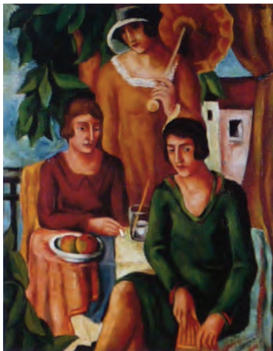
Franz Monjau. Drei Frauen im Garten . 1929 Öl/Lw., 70 × 55 cm. Stadtmuseum Düsseldorf