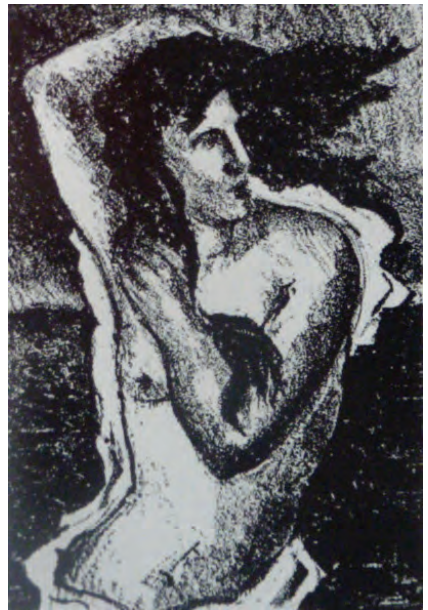
Franz Monjau. Halbakt einer Frau . 1929 Lithografie, 19 × 15 cm