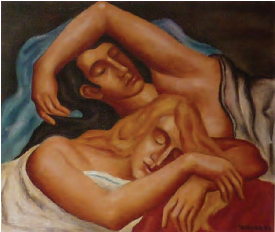
Franz Monjau. Schlafendes Paar . 1929 Öl auf Leinwand, 46 × 54 cm. Privatbesitz