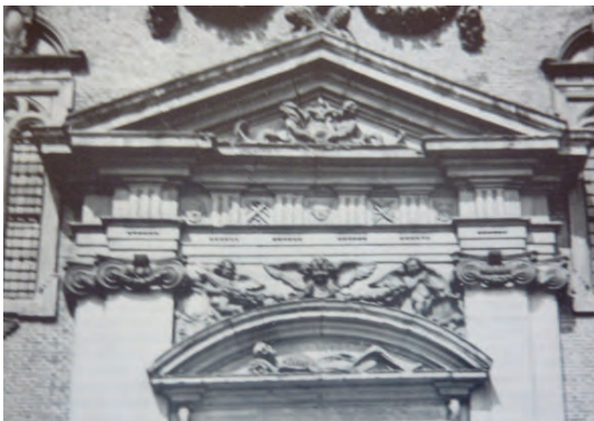
Tympanon der Kirche von Middelburg

Weisst Du noch, wie wir an dem Pfingsttag auf den Rheinwiesen lagen, als ein Geschwader nach dem anderen gen Holland flog, wie verzweifelt wir darüber waren und denkst Du an unseren Abschied in Vrouwenpolder 8 Tage vor Ausbruch des Krieges und unser letztes Foto von dem Totengerippe